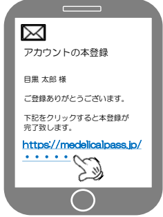
メールを開き「青文字のURL」を選択し登録を完了して下さい。