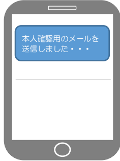
本登録メールが送信されます